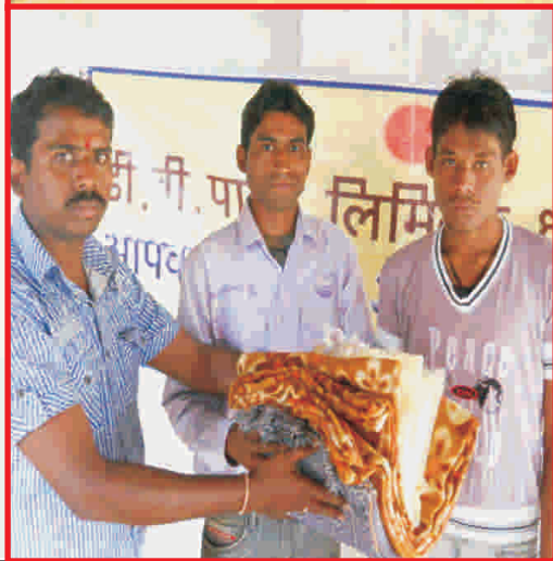
Distribution of Blankets and Bed Sheets