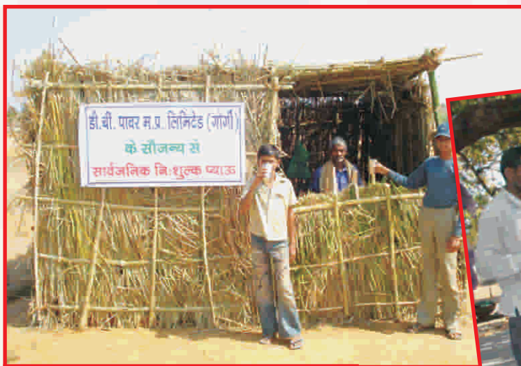
Drinking Water Stations