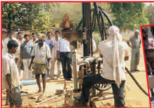
Digging of Bore Wells, and installation of Motor & Hand pumps