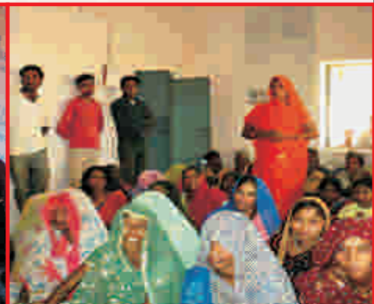
Training & Awareness Programmes on Agriculture best practices