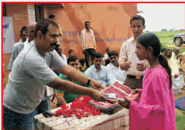
Distribution of school bags and stationery material to Primary school children