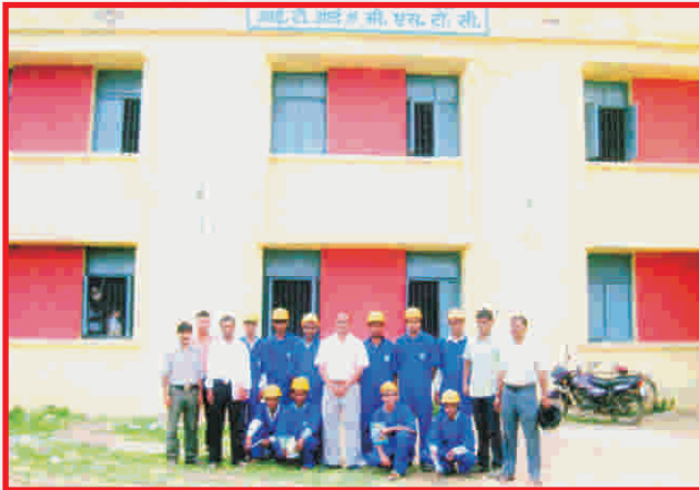
Financial Support of Rs 12,00,000 provided to ITI