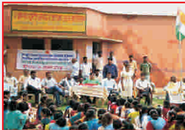
Scholarship to deserving students