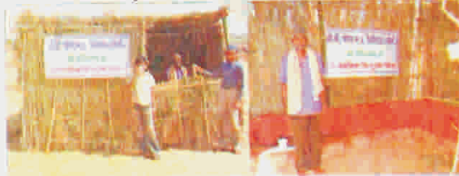
डी.बी. पावर न.प्र. लिमि. खोले गए सार्वजनिक प्याऊ