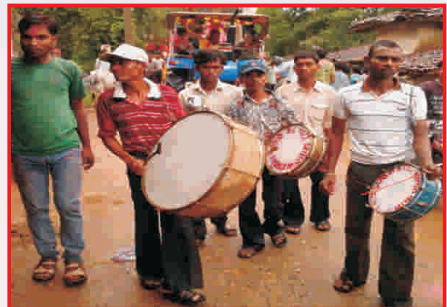
Celebration of Ganesh Pooja