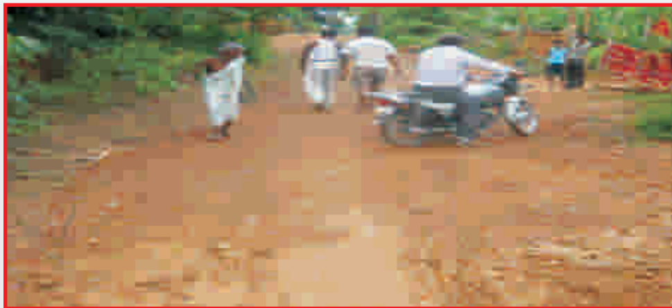
Surfacing Village Roads and cleaning bushes