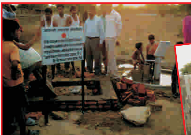
Construction of Ladies Bathrooms