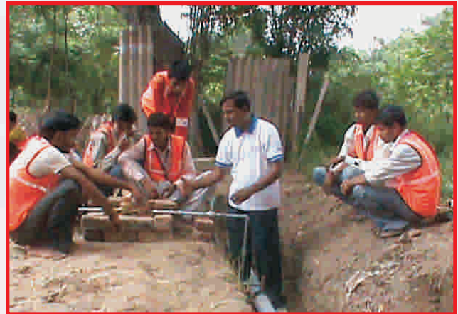
Plumbing training & placement provided to 33 BPL youth of PIA