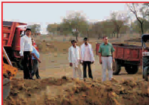
Deepening and restoration of Ponds